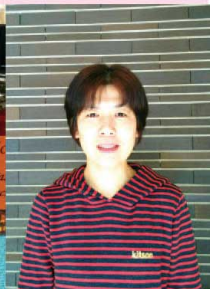
Honulea ☆ ホヌレア / Asako アロマを使ってリフレッシュ! 講座もやっています。